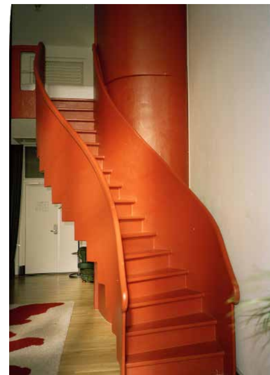
De pianokamer met knalrode trap.