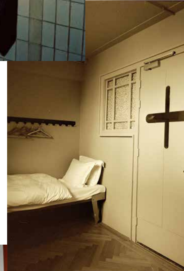
De landverhuizers werden bij hun aankomst in het hotel meteen gedesinfecteerd in een speciaal daarvoor gebouwde ruimte.