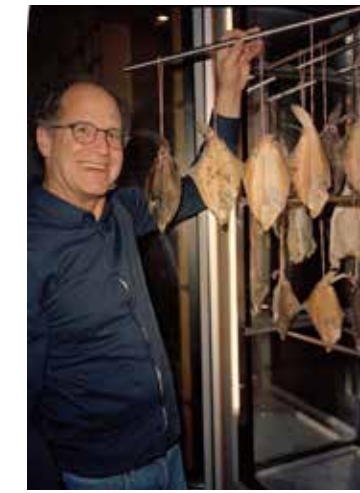
Frank's Smoke House